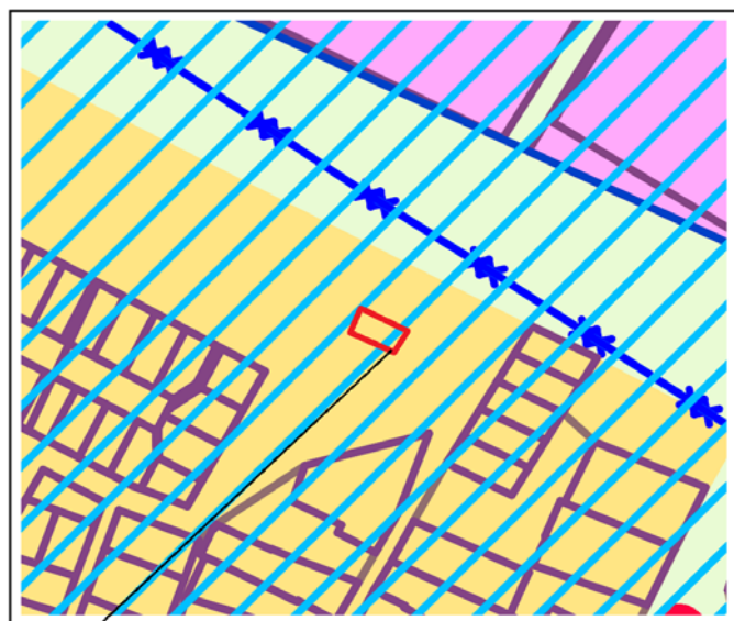
Схема градостроительного зонирования с картой зон с особыми условиями использования территории

Земельный участок с кадастровым номером 23:08:0101001:870